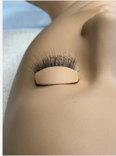
①左目エクステンション