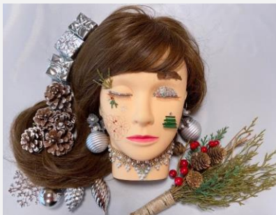
テーマ クリスマス