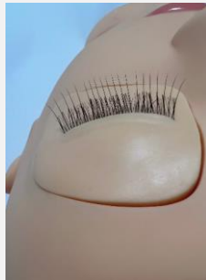
①左目エクステンション